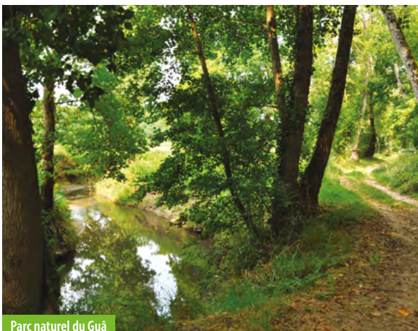
Parc naturel du Guâ

L'espace naturel qui le borde accueille une faune et une flore remarquables. Il offre un cadre paysager de qualité au centre-ville.